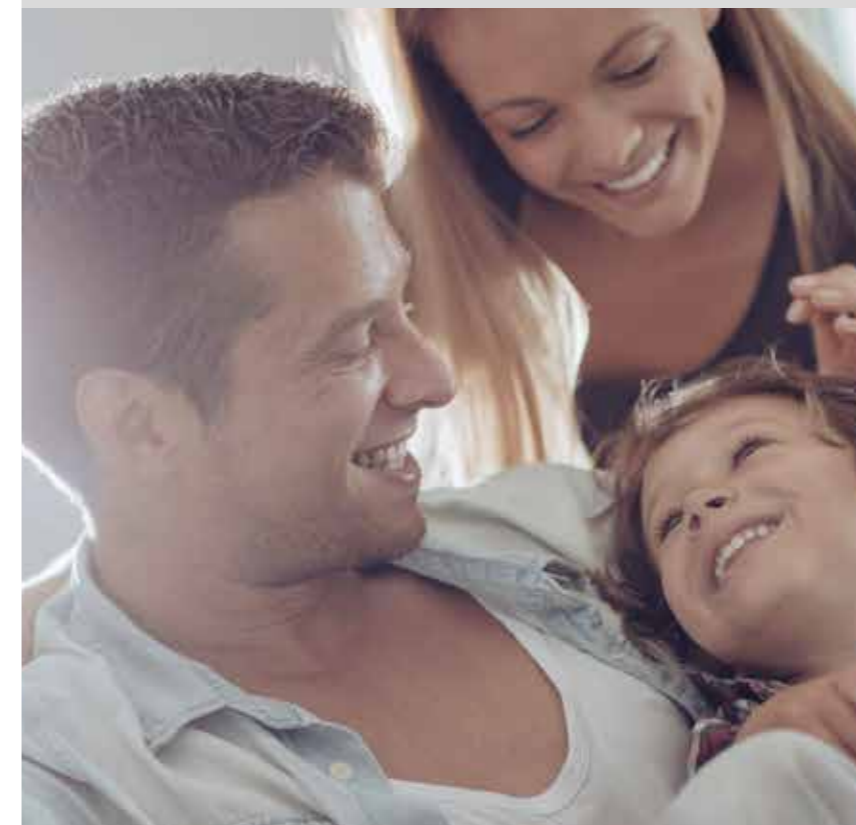
Document à caractère publicitaire

TAEF fixe de 0 % (taux débiteur correspondant de 0 %)