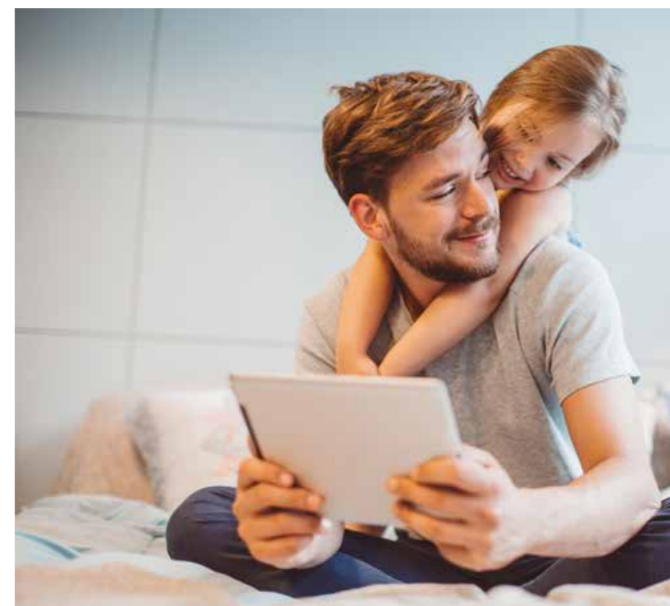
Document à caractère publicitaire

Financez l'installation d'une chaudière murale à Haute Performance Énergétique au gaz naturel ou au propane de la gamme NAEMA dans un logement existant.